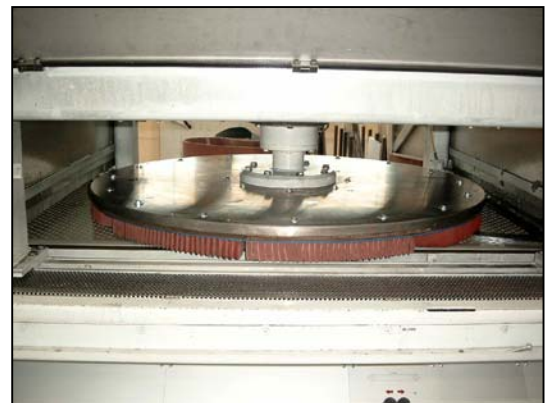
Entgratschleifsegmente im Einsatz auf einer Timesavers-Maschine

Dieser kann mit Hilfe einer Timesavers-Maschine inklusive der dazugehörigen Entgratschleifsegmente entfernt werden.