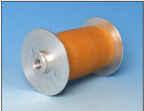
Bild: Führungsrolle FAPI-Rail

Die Führungsrolle FAPI-Rail wurde für das Schleifen von Geländern, Rohren, etc. entwickelt. Mit Hilfe eines mit Klettverschluss verschließbaren Schleifvliesbandes können mit der Führungsrolle FAPI-Rail beispielsweise Geländer, Rohre, etc. auf einfachste Art und Weise geschliffen und poliert werden.